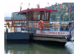
Fot. Jezioro Żywieckie.